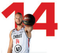
KIM TILTJE AILIER FORT