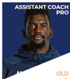
ASSISTANT COACH PRO OLD LO